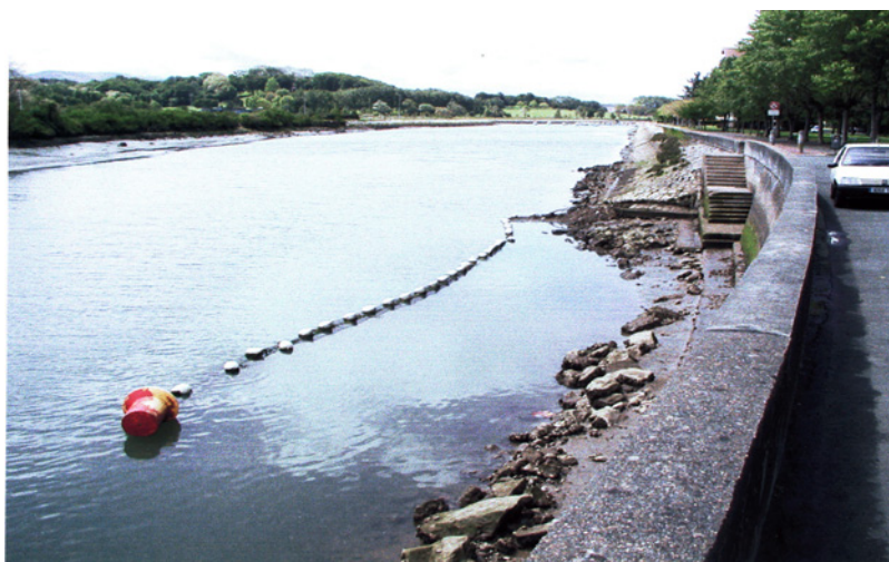
Filet sur la nivelle